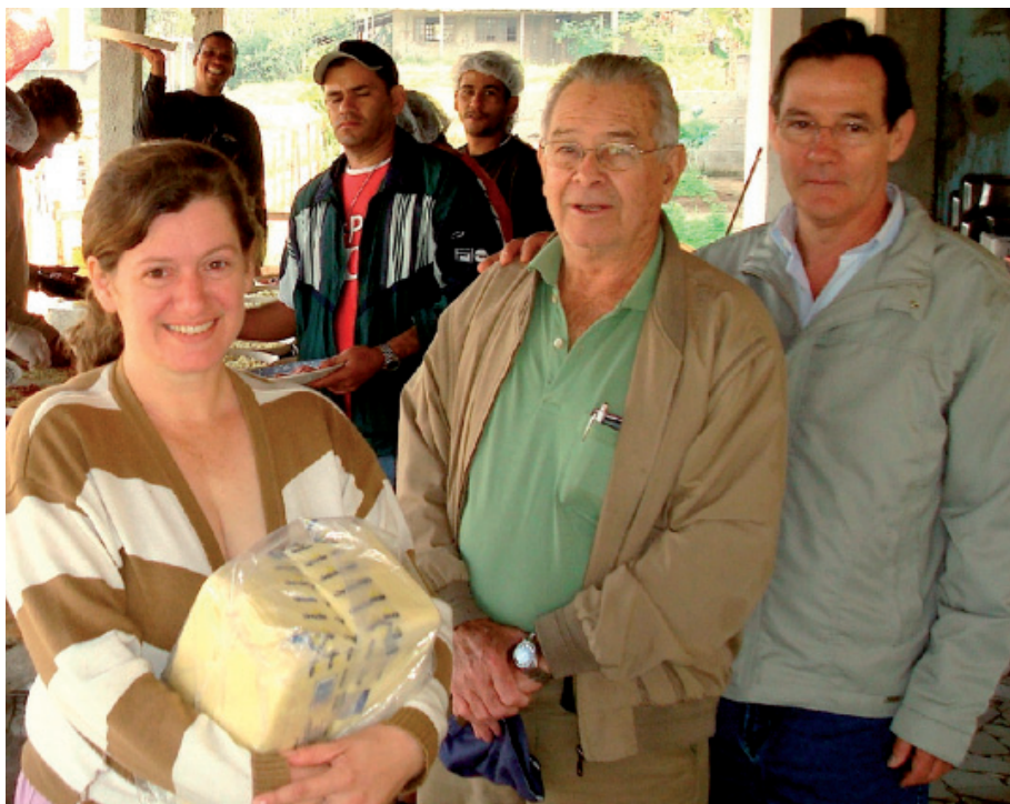
Na foto acima podemos ver o momento da entrega.

Um simples gesto de humanidade pode fazer muita diferença para a vida do próximo. Diante dessa filosofia, o SICOVAMM (Sindicato do Comércio Varejista de Bens, Serviços e Turismo de Mogi Mirim) atendeu a solicitação da Associação Resgate A Vida de Mogi Mirim e contribuiu com a doação de peças de mussarela para a confecção de pizzas.